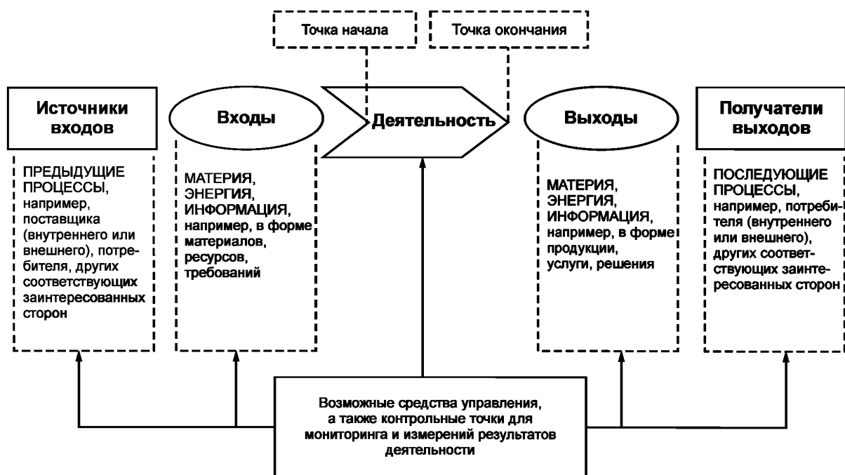
Рисунок 1 — Схематичное изображение элементов процесса

Рисунок 1 дает схематичное изображение любого процесса и иллюстрирует взаимосвязь элементов процесса. Контрольные точки мониторинга и измерения, необходимые для управления, являются специфическими для каждого процесса и будут варьироваться в зависимости от соответствующих рисков.